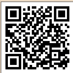
5. Budolfi Kirke