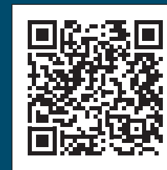
11. Vor Frelser Kirke

I første byvandring tager vi dig med igennem historien fra 1431 i middelalderen over reformationens dramatiske begivenheder i 1530'erne og frem til renæssancen i 1600-tallet.