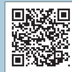
7. Mellem Broerne