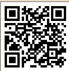
10. Jens Bangs Stenhus