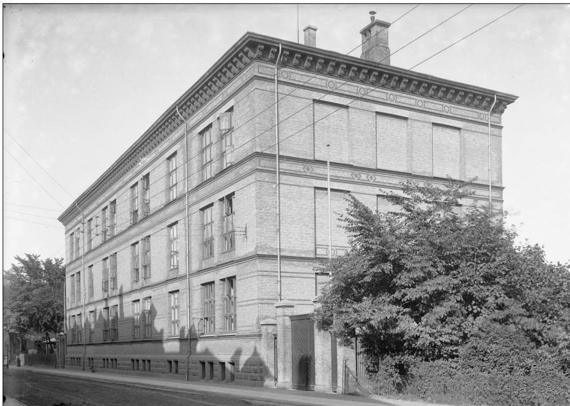
Poul Paghs Gades skole i Aalborgs vestby